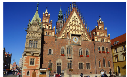
Breslauer Rathaus

Nach dem Frühstück und Kofferverladen führt unser Weg über Hirschberg entlang am Südkamm des Bober-Katzbachgebirge bis Bolkenheim, Striegau dort ca. 1 Stunde Aufenthalt, weiter nach Schweidnitz. Unser nächstes Ziel ist Kreisau (Kreisauer Kreis) Moltke Gut mit Besuch des dortigen Gutes (heute Begegnungsstätte der Deutsch/Polnischen Jugend) weiter über Zopten nach Breslau. Hotelbezug, Stadtrundgang, Abendessen und evtl. Bummel über den Ring.